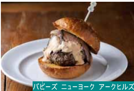
パピーズ ニューヨーク アークヒルズ

食欲の秋にふさわしい肉づくしのメニューも登場。毎年大人気のボリューム満点バーガーや、ほくほくの肉まん、華都飯店からは、中華風牛丼がラインナップ。キノコやサツマイモなどの旬食材もたっぷり使った秋の味覚丼です。