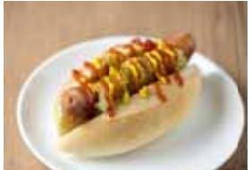
ディーン&デルーカ