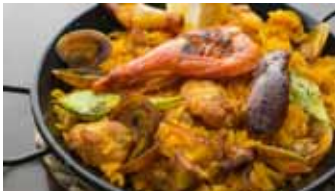
スペイン バレンシアナパエリア プリーチョ

ガツンとお腹を満たす主役級のメニューが盛り沢山。パエリアやピザ、お好み焼きなど、大人数でシェアするのも。バラエティあふれる和洋折衷なラインナップで展開します。店舗よりもリーズナブルに味わえるお得感も満載です。