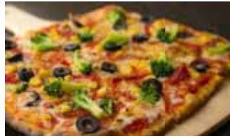
ウルフギャング・バック ピッツァパー