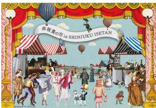
【通常開催の「赤坂蚤の市」の様子】

問合せ先: 森ビル株式会社 タウンマネジメント事業部 (03-6406-6663)