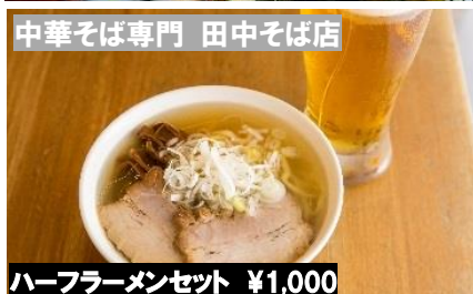
中華そば専門 田中そば店