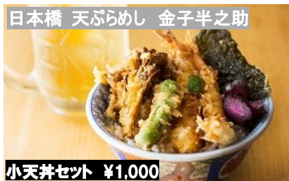
日本橋 天ぶらめし 金子半之助