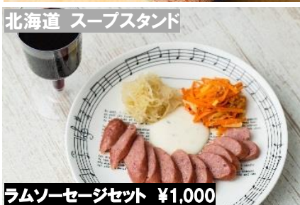
北海道 スープスタンド