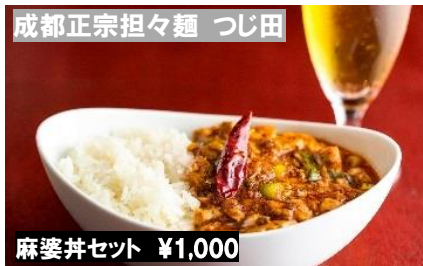
成都正宗担々麺 つじ田