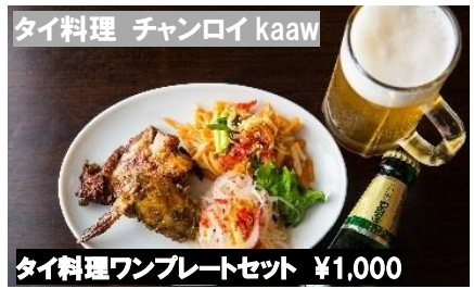
タイ料理 チャンロイ kaaw