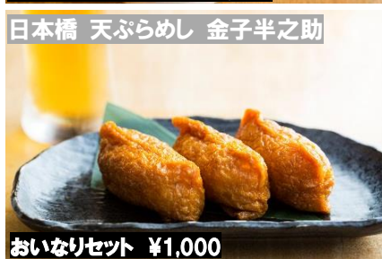
日本橋 天ぶらめし 金子半之助