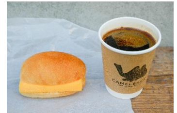
すしやの玉子サンドとドリップコーヒー 玉子サンド¥400 ドリップコーヒー¥400