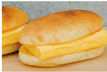
すしやの玉子サンド