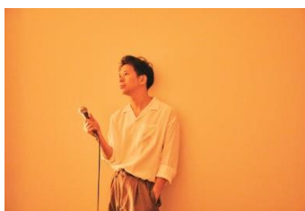
ARK HILLS CAFÉ Keishi Tanaka 『I'm With You Tour』 10月10日(日)18:00～