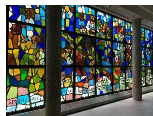
霊南坂教会 チャペルコンサート 10月6日(水)12:30～12:55

※各コンサートプログラムの詳細および申し込み方法は 公式サイト からご確認ください。