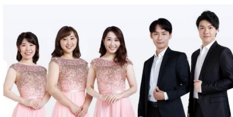
住友不動産六本木グランドタワー アトリウムコンサート 10月5日(火)18:00～18:45