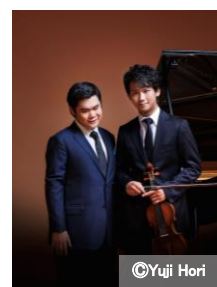
辻井伸行・三浦文彰

詳細URL： https://www.suntory.co.jp/suntoryhall/article/detail/000632.html